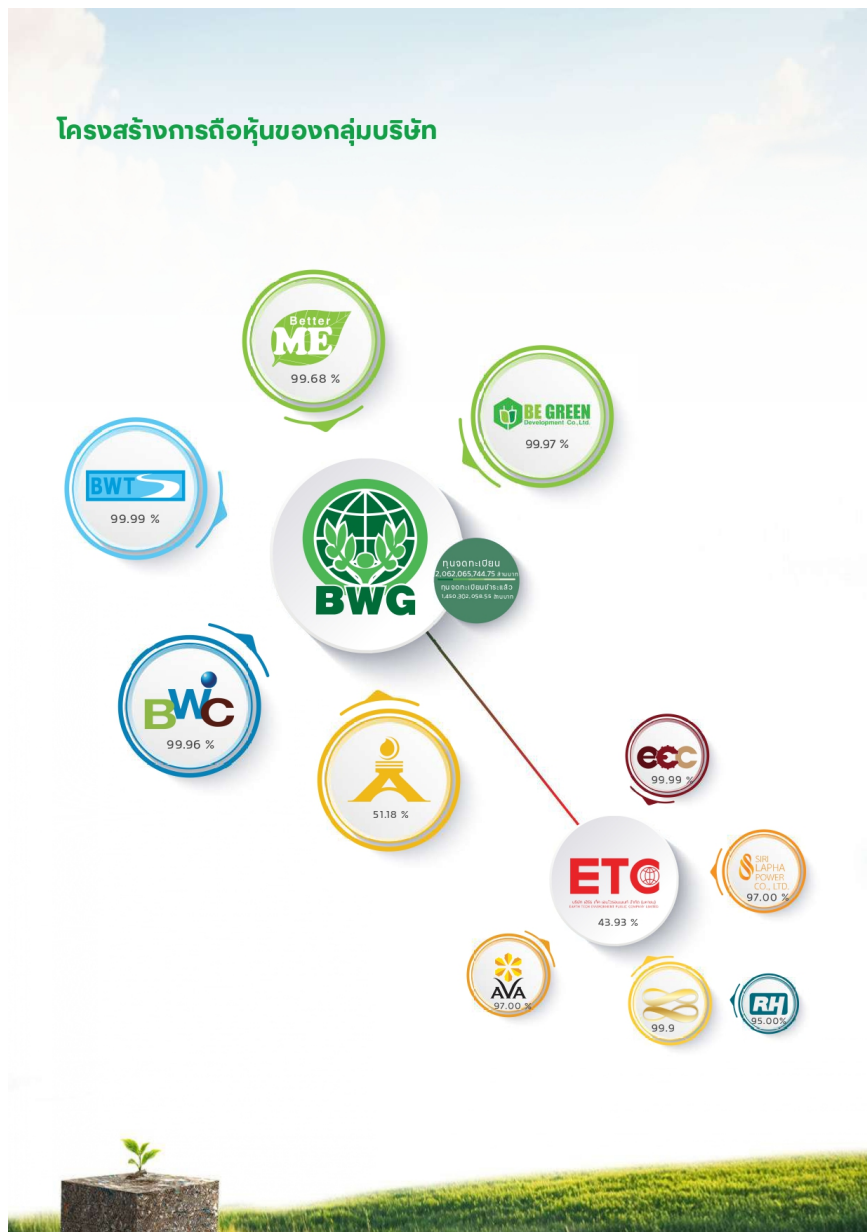
โครงสร้างการถือหุ้นของกลุ่มบริษัท